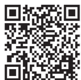
ときがわ町 PR ソングが 決定しました!